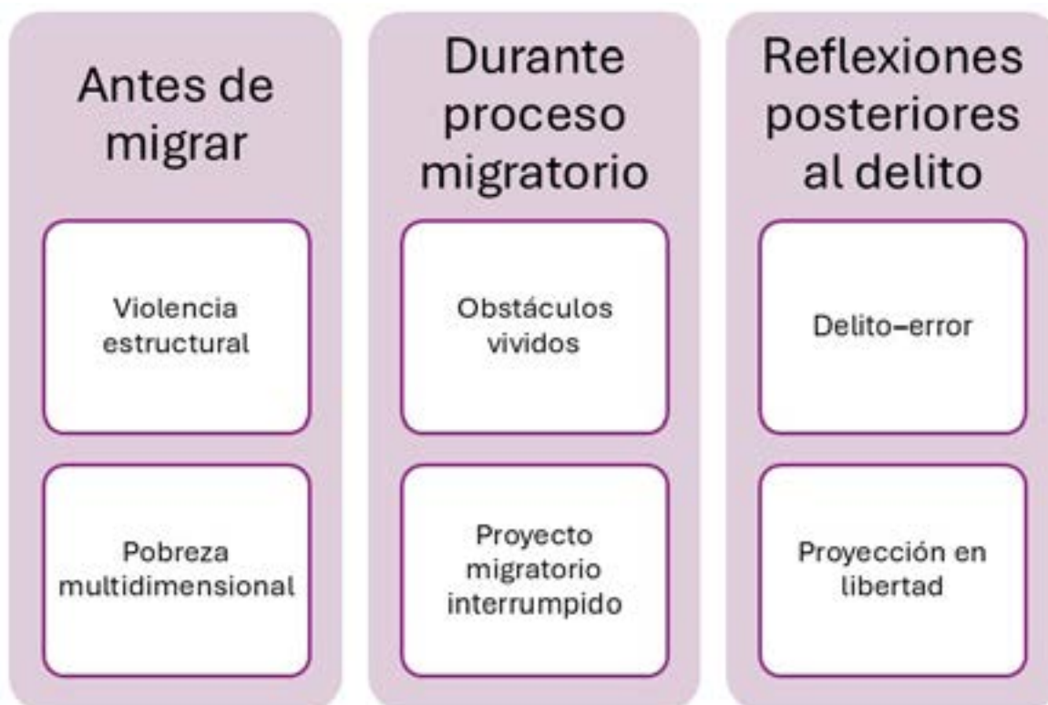
Figura 1: Esquema síntesis de resultados